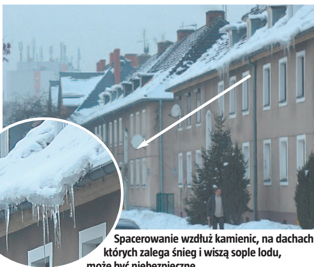
Spacerowanie wzdłuż kamienic, na dachach których zalega śnieg i wiszą sople lodu, może być niebezpieczne.